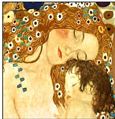
Mère et enfant, Gustav Klimt

Le mois de juillet et le mois d'août sont pour la plupart d'entre nous une période de repos, de calme, en tous cas de changement par rapport à notre routine habituelle. Par exemple, certaines villes se vident, et d'autres se remplissent, comme des marées. L'été c'est aussi « marée basse » dans notre vie. L'occasion de marcher sur la plage de nos vies ; s'étonner de redécouvrir le fond de notre océan ; retrouver de beaux coquillages sur le sable... perles rares de nos vies : des amis, des proches ou des lieux qui nous sont chers.